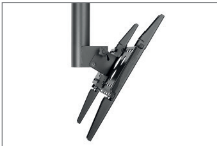
werkzeuglos -5 bis +30° neigbar