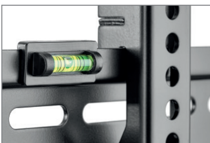
abnehmbare Wasserwaage inklusive